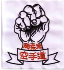
Escudo estilo Goju Ryu

El Goju Ryu es un estilo de karate creado en Okinawa. La traducción literal es Go (Duro), Ju (Suave) y Ryu (estilo): Estilo duro-suave , dado que es una combinación de estos conceptos. En 1933 fue registrado oficialmente con ese nombre en la Dai Nihon Butokukai. El fundador de este estilo es el maestro Chojun Miyagi.